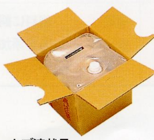
スーパーナブ液状品 (天然腐植ミネラル水)

*この「スーパーナブ」は、水産(海水、淡水魚)用としてもご利用戴いています。 *姉妹品として棒状ペレット「ピジトス」を汚水処理用に開発してあります。 汚水・排水処理(浄化作用)にお役に立ちますので、是非一度お試しください。