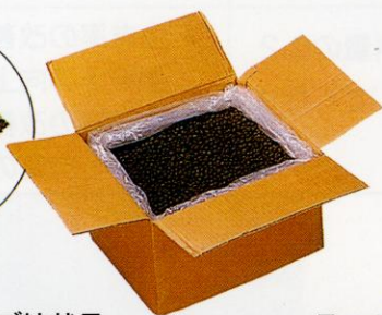
スーパーナブ粒状品 (天然腐植ペレット)