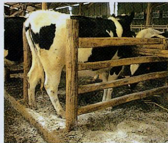
③フリーストールの寝床衛生に。