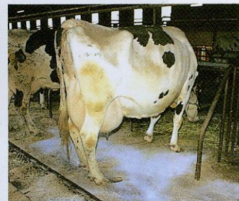
②牛床への散布状況。