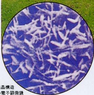
結晶構造 の電子顕微鏡 写真