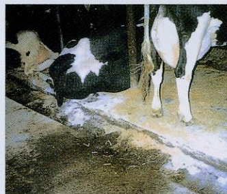
①バンクリーナー内への散布。