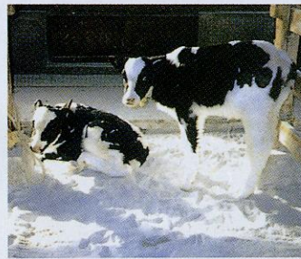
⑤子牛育成への多量使用。