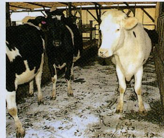
④通路のすべり止、下地に。