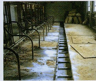
⑥放牧後の畜舎衛生作業。